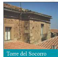
Torre del Socorro

Muchas torres de la muralla cacereña no aparecen a simple vista. A veces, sus restos están ocultos dentro de otras construcciones posteriores o simplemente se utilizaron como 'materia prima' en el resto de la ciudad, en la construcción de los palacios, las casas, los templos... incluso en la reconstrucción de otras torres. Descubrir este patrimonio oculto supone un encuentro con los elementos ocultos de la ciudad