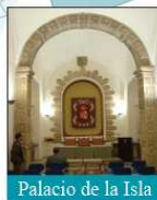
Palacio de la Isla