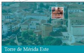
Torre de Mérida Este

El Principal fue el primer teatro estable que tuvo la ciudad de Cáceres. Funcionó como sala escénica desde el año 1802 hasta 1924